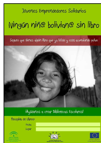
Cartel para la campaña de recogida de libros