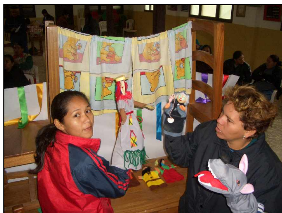
Profesoras en el taller ¿Jugamos?

Por sexto año consecutivo, AEPECT ha desarrollado sus actividades de Acción Solidaria que, encuadradas dentro del Plan La Educación, Puerta del Desarrollo , tienen su actividad principal en Bolivia. El trabajo realizado en la formación de docentes ha sido enorme, pero también se han dotado con más libros las bibliotecas ya existentes y ayudado a la formación de otras nuevas; se han donado 40 botiquines completos para que puedan servir en caso de emergencia en otros tantos centros y, en colaboración con la Fundación Hombres Nuevos, se está equipando de material dos talleres profesionales en la región de la Chiquitanía. No obstante, y por primera vez, también ha