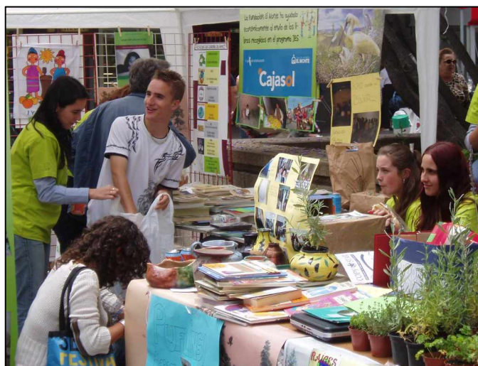
Alumnos colaboradores de AEPECT en la feria de asociaciones JES

El resultado ha sido positivo, de tal modo que está a punto de firmarse un nuevo convenio para fijar nuestra participación en el presente curso escolar, en el que el número de centros ha crecido de 6 a 11. Para este curso ya se han buscado 11 unidades educativas bolivianas entre las solicitudes que en este sentido recogieron nuestros voluntarios. Todas ellas están dispuestas a