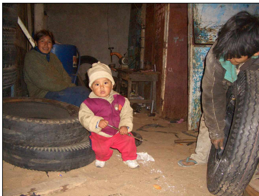
Joven familia con su bebé

En coordinación con Hombres Nuevos, nuestra contraparte en este proyecto, se están llevando a cabo las actuaciones necesarias para dotar al centro de dos talleres artesanales solicitados por la población y que son acordes con las actividades que en este sentido se producen en la zona. Uno de ellos es para el trabajo de tallado en madera y la fabricación de instrumentos musicales y otro para la creación de tejidos y bordados. De esta manera, el alumnado podrá terminar su escolaridad con un nivel de técnico artesanal medio.