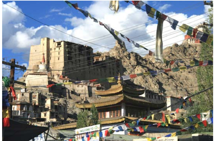
Leh, capital de Ladakh (Javier Lario)

Ladakh constituía históricamente una zona de paso de la Ruta de la Seda desde la India hacia el Tíbet. Desde que el Budismo se extiende por esta zona cerca del s. VII, han existido unos fuertes lazos religiosos con Tíbet, existiendo intercambios culturales entre los monasterios budistas de los dos Reinos. Con el cierre de la frontera con China después de la ocupación del Tíbet en 1956, se cerraron los lazos comerciales y culturales con el Tíbet, pero ese aislamiento ha permitido que sea en esta zona donde se puede observar la cultura y tradiciones tibetanas más fieles a las originales. En este viaje vamos a intentar compaginar el estudio de la geología de la zona con un acercamiento a la cultura budista de esta zona del Himalaya.