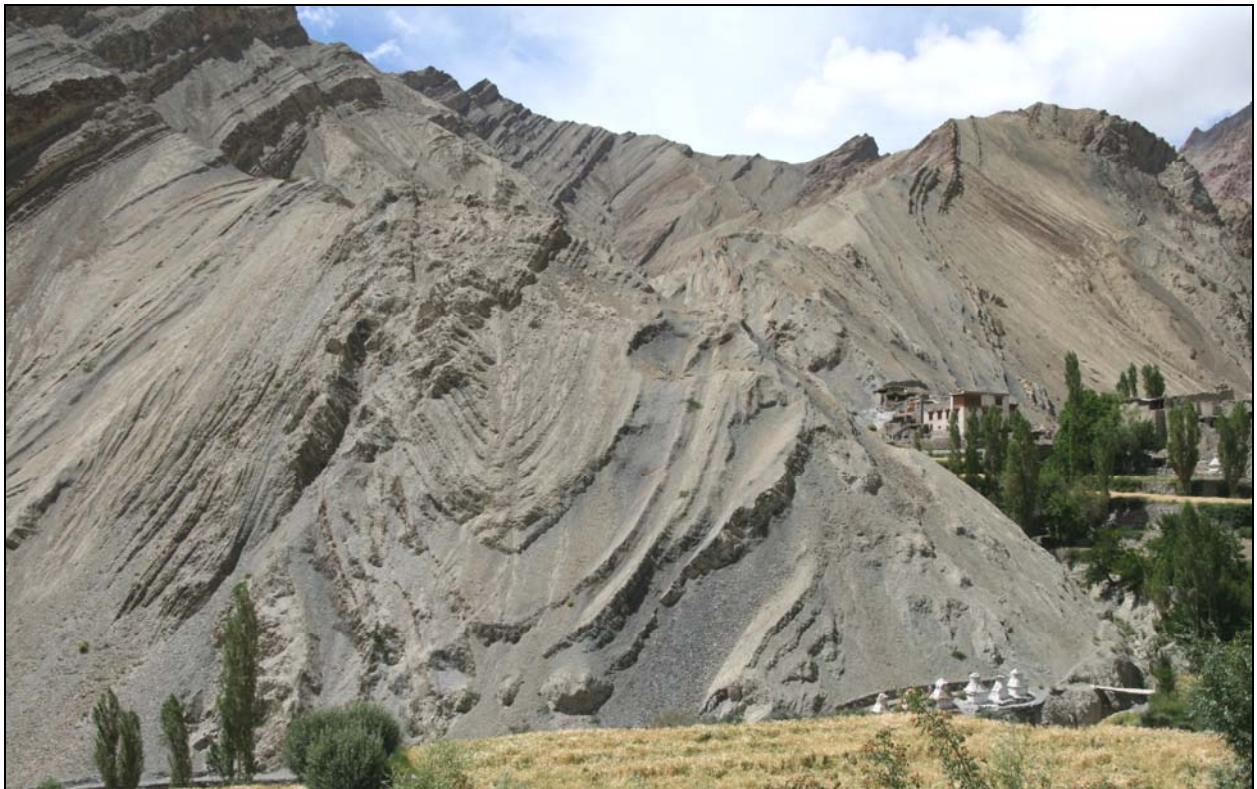
Alrededores de Timosgam, Ladakh (Javier Lario)

Del 13 al 31 de agosto de 2010 (por confirmar)